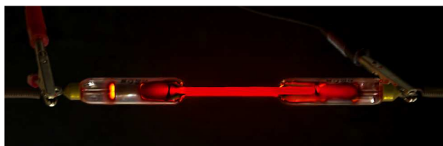
Figura 1. Tubo de descarga de neón [4]

El neón es el gas noble menos reactivo, sin embargo se sabe que forma un compuesto con flúor \text{F}_8\text{Ne}_7 . A partir de estudios de espectrometría óptica y de masas se han detectado los iones \text{Ne}^+ , (\text{NeAr})^+ , (\text{NeH})^+ y (\text{HeNe})^{2+} .