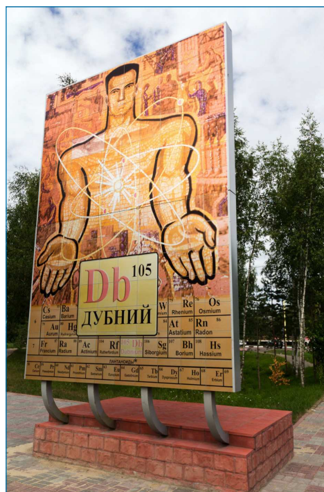
Figura 1. Monumento conmemorativo del descubrimiento del elemento dubnio en la ciudad rusa de Dubná [4]

debido que se obtienen muy pocos núcleos durante su preparación, y su intervalo de estabilidad es corto. No obstante, se ha podido concluir que forma preferentemente especies pentacoordinadas de tipo oxihaluro como [DbOCl 4 ] - y [DbOF 4 ] - , a diferencia del tántalo para el que se observan mayoritariamente especies hexacoordinadas como [TaF 6 ] - .