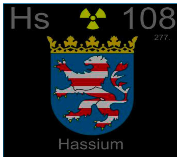
Figura 1. Representación de una casilla de la tabla periódica para el hasio, donde se ha incluido el escudo del estado alemán de Hesse [5]

Entre los datos estimados se pueden citar un radio covalente de 134 pm y una entalpía de fusión de 20,5 kJ/mol 2 . Asimismo, se han estimado valores para las tres primeras energías de ionización.