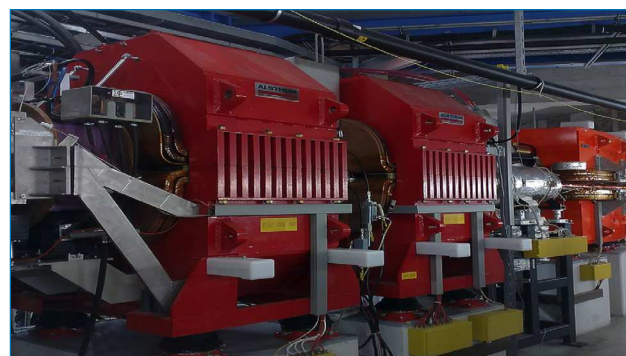
Figura 1. Acelerador de iones pesados de las instalaciones del Gesellschaft für Schwerionenforschung (GSI), Darmstadt, Alemania

Por último, en cuanto a sus usos y aplicaciones se refiere, debido a su alta radioactividad y a su período de desintegración, no se ha encontrado utilidad práctica aún, limitándose su uso a la realización de estudios teóricos físicoquímicos.