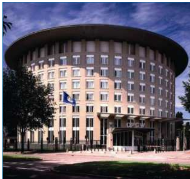
Figura 1. Sede de la OPAQ en La Haya (Países Bajos)

La CAQ exige la destrucción de todos los arsenales químicos, instalaciones de producción, almacenamiento y