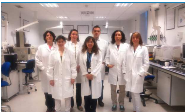
Figura 5. Expertos del LAVEMA

Actualmente en el mundo hay 19 laboratorios de estas características y el LAVEMA es el único de habla española. Por su reconocido prestigio, la OPAQ lo ha elegido para dar formación a otros centros que están en vías de consecución de la ansiada certificación de eficiencia, así como pilotar una Red de laboratorios de habla española.