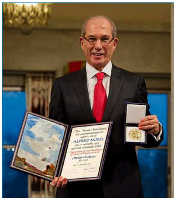
Figura 2. Director General de la OPAQ, Embajador Ahmet Üzümcü con el diploma y medalla del Premio Nobel de la Paz, 2013

En materia de verificación a la industria –actividad esencial para asegurar la no proliferación– la OPAQ ha realizado 2.600 inspecciones en más de 86 países. A través