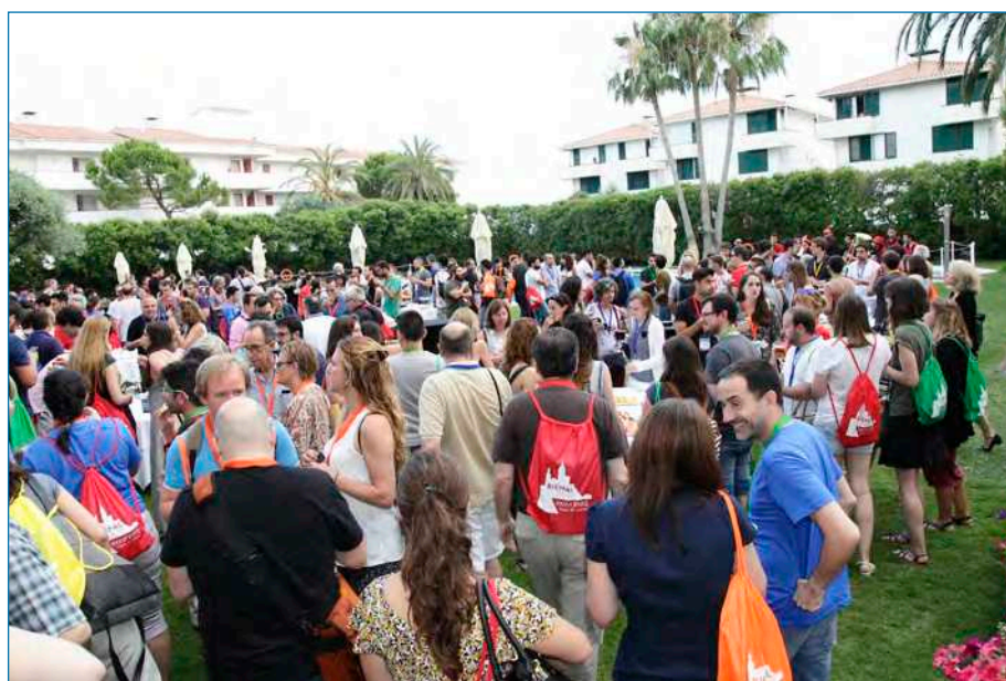
Panorámica del coctel en el que participaron un buen número de asistentes