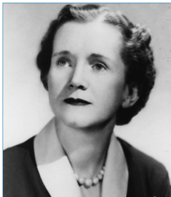
Figura 1. Rachel Carson

Silent Spring está considerada una de las grandes obras de divulgación científica, de hecho se trata de la obra fundacional del movimiento ecologista. En ella Rachel Carson consiguió que la ciudadanía cambiara paulatinamente su opinión sobre los pesticidas, modificando el corpus ideológico de una sociedad.