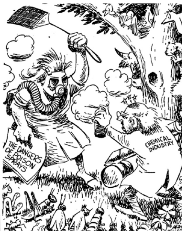
Figura 5. Frank Miller, “Backyard Battle”, Des Moines Register , 26 de julio de 1962.

Para comprender la pluralidad de contextos, personajes e intereses relacionados se repasarán a continuación las principales actividades que se llevaron a cabo a raíz del aniversario, tanto en España como a nivel internacional. En España se organizaron diversas actividades, como la traducción del libro póstumo de Rachel Carson, The Sense of Wonder (1965), o una mesa redonda celebrada en el Institut d'Estudis Catalans. [11] A nivel internacional cabe destacar la creación de páginas webs dedicadas a la vida y obra de Carson como, por ejemplo, Enviroment & Society Portal . [12] Además, algunas revistas, como Ambix [13] y Endeavour , [14] publicaron números especiales en los que se recogían trabajos académicos analizando el libro Silent Spring . Entre estos trabajos se ha considerado especialmente interesante y novedoso el análisis de las viñetas