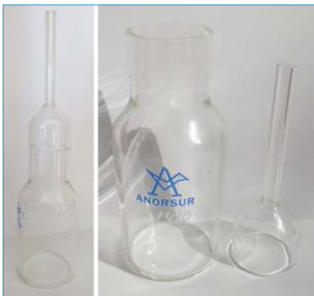
Figura 4. Ampolla de vidrio empleada para almacenar los elementos

Los elementos Na y K, que tienen puntos de fusión relativamente bajos, se fundieron en sendos matraces y se introdujeron en las ampollas en estado líquido. En las condiciones en las que se efectuaron las transferencias de estos metales en estado líquido, el sodio adquirió una ligera tonalidad amarilla, [12] mientras que la del K fue azul. [13] Estos colores característicos son el resultado de reacciones superficiales que reflejan su identidad y se manifiestan como señales diferenciadoras. Por ello no se ha creído conveniente la eliminación de estas finas capas que se encuentran depositadas sobre la superficie de estos elementos. La misma norma se ha seguido con algunos de los restantes elementos de la TP, que también presentan una ligera contaminación superficial, principalmente formada por sus óxidos. El elemento Ga originó algunos problemas debido a su bajo punto de fusión, 30 °C, que al estar bajo vacío es algo inferior. Con el clima local, este elemento se fundía en verano y se volvía a solidificar durante el invierno. La diferencia en las densidades de ambas fases provocaba que en invierno la ampolla se resquebrajara. La solución fue depositar en la ampolla una cantidad de galio lo suficientemente pequeña para que no hiciera mucha presión sobre el vidrio, evitando de esta manera que se rompiera al solidificar. [14]