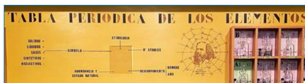
Figura 8. Encabezado de la TP con el retrato de Dimitri Mendeleiev

Nuestra TP con muestras reales de los elementos químicos, original y emblemático acervo científico de la Universidad de Sevilla, está colocada en el pasillo de entrada al Departamento de QI y, sin excepción, atrae la atención de todos los alumnos, profesores y visitantes que pasan por allí. Aunque no está abierta al público en general, la pueden visitar los estudiantes de otros centros educativos que soliciten el correspondiente permiso a las autoridades académicas competentes. Ver esta TP, y recibir algunas explicaciones precisas sobre ella, es una de las actividades que realizan muchos estudiantes, sobre todo alumnos de secundaria en las distintas visitas concertadas o en jornadas de divulgación. Por ejemplo, en días cercanos a la festividad de San Alberto Magno tienen lugar, en el marco de la semana de la Ciencia, las jornadas de divulgación QUIFIBIOMAT que todos los años organiza la Facultad de Química junto con las facultades del campus científico de Física, Biología y Matemáticas. Para finalizar