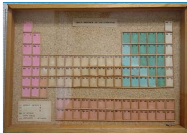
Figura 5. Maqueta original de la propuesta de construcción de la TP