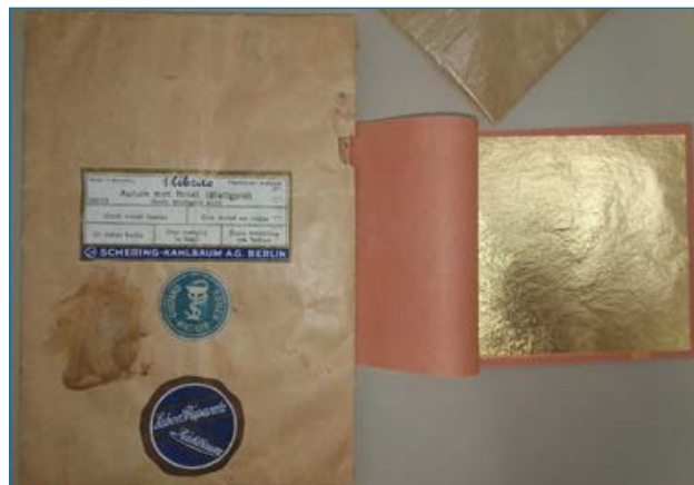
Figura 2. Muestras de pan de oro que se han utilizado para este elemento en la TP

Hay algunos datos curiosos que reseñar, por ejemplo los relativos a las muestras de los elementos cloro y oro. El primero se obtuvo de las síntesis que se realizaban en el la-