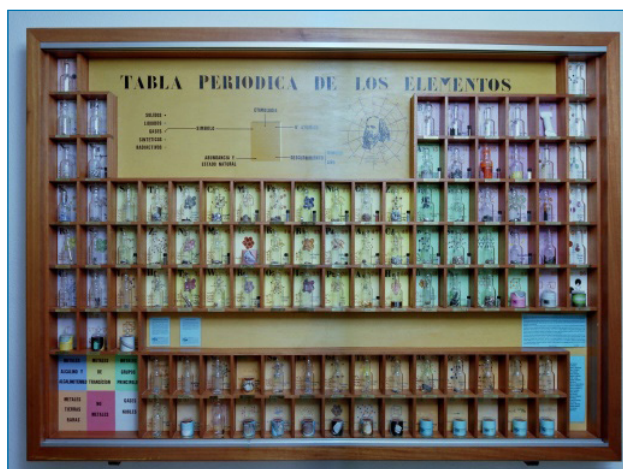
Figura 1. Tabla periódica con muestras reales de los elementos químicos ubicada en el Departamento de Química Inorgánica de la Universidad de Sevilla