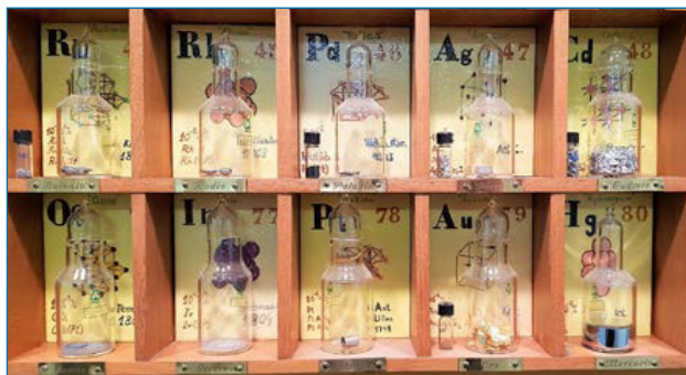
Figura 7. Ejemplo de azulejos de algunos elementos

lugar se muestran fotografías del elemento, de alguno de sus compuestos, o de la nota de un cuaderno de laboratorio donde se describe su detección y descubrimiento. En las últimas décadas, se han añadido a la TP quince elementos nuevos, hasta completar los 118 que se conocen hasta el presente. [19] Todos son inestables, altamente radiactivos y se ubican a continuación del actinio. De estos elementos no se han incluido todavía las celdillas correspondientes en la TP.