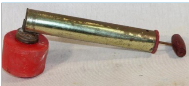
Figura 6. Fumigador utilizado en la preparación artesanal de los azulejos de cada elemento

En la actualidad, la TP contiene muestras reales de 83 elementos químicos, todos los que se pueden exponer y conservar sin necesidad de adoptar precauciones especiales. Entre los que las requieren está el flúor, que no se puede almacenar en vidrio debido a su alta reactividad, y constituye el único de los elementos no radioactivos que no se encuentra en nuestra TP en su estado elemental; en su lugar hay una muestra de teflón. Los veinte que faltan para componer la TP clásica de 103 elementos son muy radioactivos y en consecuencia no se pueden exponer. En su