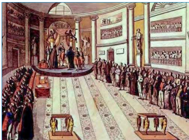
Figura 6. Jura de la Constitución de 1812 en las Cortes por Fernando VII, el 9 de julio de 1820. Colegio convento de Doña María de Aragón (actualmente Palacio del Senado) de Madrid

dado que se promueve la colaboración entre distintas instituciones.