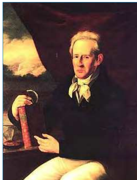
Figura 1. Retrato de Andrés Manuel del Río, con un goniómetro para medida de ángulos cristalográficos y señalando uno de sus libros. Palacio de la Minería (Ciudad de México)

La propuesta se gestó por el interés del Grupo Especializado en Didáctica e Historia de la Física y la Química (GEDHFQ), común a las Reales Sociedades Españolas de Física y de Química, por difundir diferentes aspectos sobre la tabla periódica, cuando se acercaba la celebración de su año