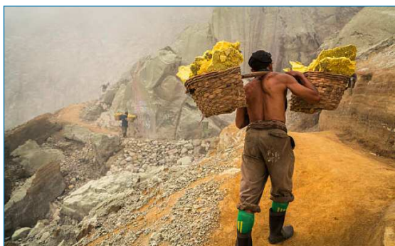
Figura 1. Minería a cielo abierto de azufre en el cráter del volcán Kawah Ijen, Java Oriental, Indonesia

Se conocen modificaciones alotrópicas del azufre debido tanto a las diferentes formas de unirse los átomos de azufre