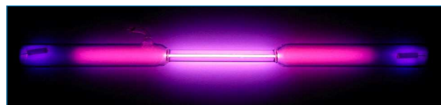
Figura 2. Tubo de descarga relleno de argón.

Por otro lado, se ha sintetizado el fullereno endoédrico \text{Ar}@C_{60} , siendo el más estable de todos los preparados con gases nobles. [4]