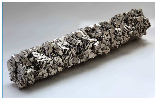
Figura 1. Barra de titanio de alta pureza (99,995 %) [5]

de golf y bicicletas), ordenadores portátiles, muletas y joyería. [2]