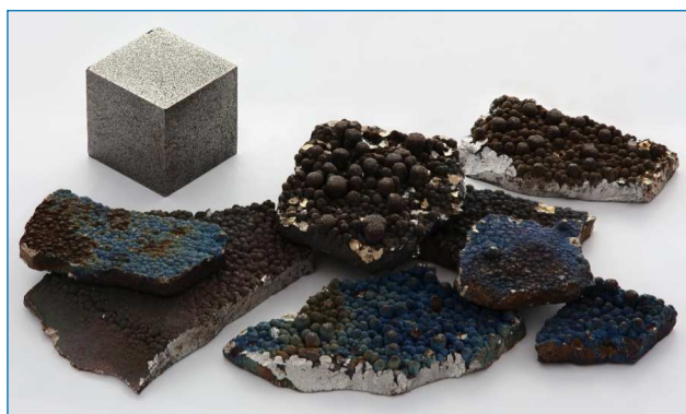
Figura 1. Fragmentos de Mn puro (99,99 %) refinado electrolíticamente, con el aspecto típico de una superficie oxidada por el aire, así como un cubo de 1 cm 3 de Mn de alta pureza (99,99 %), para comparar [https://bit.ly/2TEd7Le, visitada el 12/03/2019]

El manganeso metálico es un metal grisáceo muy frágil (Figura 1) y no se usa en estado puro, sino como aleaciones, especialmente en el acero, donde un 1 % de Mn mejora la dureza y resistencia. El acero de manganeso contiene 12-14 % de este metal, es extraordinariamente duro y resistente a la abrasión, y recibe usos especiales como en las vías del tren, cascos o la manufactura de rifles. Otros compuestos de manganeso de interés comercial son el dióxido, el sulfato y el permanganato de potasio; el primero se utiliza como catalizador y en baterías, el segundo en la manufactura del manganeso metálico y en la preparación de fungicidas, y el tercero es un oxidante común, que sirve para purificar gases y aguas residuales que contienen materia orgánica. Asimismo, el dióxido de manganeso es