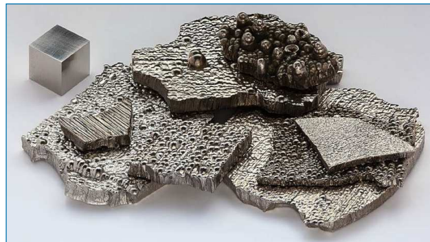
Figura 1. Algunos fragmentos de cobalto puro (99,9%) refinado por electrólisis, junto a un cubo de 1 cm 3 de cobalto de alta pureza (99,8% = 2N8) para comparar

El principal país productor y exportador de cobalto es la República Democrática del Congo, que posee los mayores yacimientos del mundo, seguido de Australia, Cuba, Filipinas, Zambia, Rusia y Canadá. [5]