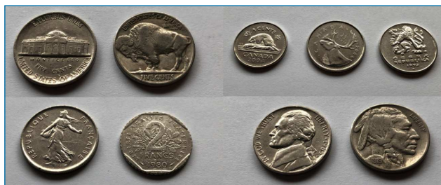
Figura 1. Diferentes monedas en las que se utiliza níquel para su elaboración.

El níquel es un metal de color plateado que resiste la corrosión, incluso a temperatura elevada, y es ferromagnético a temperatura ambiente. Es un metal de transición cuyo estado de oxidación más estable es +2, por lo que sólo se conoce el óxido NiO. Al ser un metal del bloque d , puede formar multitud de complejos de coordinación con gran variedad de geometrías, e incluso formar enlaces de carácter organometálico con átomos de carbono, como en el caso del [Ni(CO) 4 ], el primer carbonilo descubierto y que también puede utilizarse para aislar Ni metálico. [3]