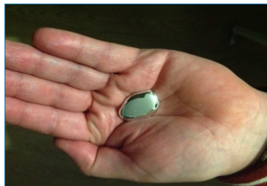
Figura 1. El galio se derrite en la mano

Los investigadores han descubierto la biocompatibilidad del nitruro de galio. Este descubrimiento podría conducir a electrodos más seguros y eficientes que estimulen las neuronas en el cerebro para tratar trastornos neurológicos como el Alzheimer. El isótopo radiactivo 67 Ga es utilizado en exploraciones mediante scanner para detectar tumores o infecciones en el cuerpo humano. [5] En el campo de la medicina, los compuestos de galio(III) tienen un importante efecto bactericida al competir con el hierro(III) en las cadenas metabólicas oxidativas de las bacterias.