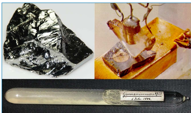
Figura 1. Primera precipitación de sulfuro de germanio (debajo), pedazo de germanio elemental (izquierda) y primer transistor fabricado por los Laboratorios Bell con un bloque de germanio policristalino ultra puro (derecha) [2]

El germanio \alpha , alótropo habitual en condiciones normales, es un semimetal de color blanco grisáceo lustroso y quebradizo que tiene la misma estructura que el diamante (Figura 1). Ocupa la posición seis en la escala de Mohs de dureza,