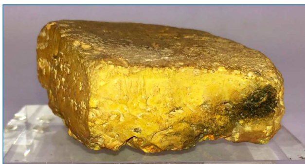
Figura 1. Fotografía de una muestra del mineral natural oropimente amarillo. Museo Geominero de Madrid

En la naturaleza, además del oropimente ( auripigmentum , pigmento dorado) (Figura 1) que se puede encontrar en las fumarolas de los volcanes y en fuentes hidrotermales templadas y que se puede formar como subproducto de descomposición de otros sulfuros como el rejalgar por acción de la luz solar, también podemos encontrarlo en forma nativa o en la arsenolita, As 4 O 6 , la arsenopirita, FeAsS, la enargita, Cu 3 AsS 4 , y otros minerales en conjunción con otros metales como Pb, Fe o Cu. [3] Aun así, la abundancia relativa de arsénico es pequeña (0,00021 %) siendo el 52º elemento en abundancia en la corteza terrestre. En España se encuentra en diversos yacimientos de los que destaca el de Guadalcanal (Sevilla) en el que se halla formando nódulos esferoides con plata nativa. En el método que se