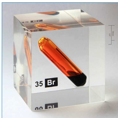
Figura 1. Vial de bromo líquido en equilibrio con su fase gas dentro de un recipiente de metacrilato [3]

La obtención del bromo implica la oxidación de los bromuros, su mena natural. Este proceso de obtención se puede realizar por las vías ordinarias: oxidación química en medio ácido (con MnO 2 , KMnO 4 ...) o bien por oxidación electroquímica. En la actualidad, se obtiene por oxidación de los bromuros con cloro, y el bromo líquido que se obtiene muy impuro, se destila fraccionadamente para obtenerlo como un líquido denso de color rojo parduzco (Figura 1). [3] El máximo productor de bromo en el mundo es Estados Unidos, cuyas salmueras de Arkansas contienen cerca de 5000 ppm y las de Míchigan poseen unas 2000 ppm. También es importante la producción del Mar Muerto, cuyas aguas tienen una concentración de cerca de 5000 ppm. El bromo se encuentra en todos los mares y lagunas