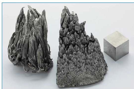
Figura 1. Dos muestras de itrio dendrítico sublimado y cubo de itrio de 1 cm 3 de alta pureza [3]

Se encuentra especialmente en minerales de tierras raras y se suele preparar comercialmente de manera similar a como lo hizo Wöhler en el siglo XIX, por reducción metalotérmica de YCl 3 con calcio. Es un metal de color plateado, relativamente estable al aire, aunque arde a temperaturas superiores a 600 °C (en forma de virutas puede arder espontáneamente a temperatura ambiente) (Figura 1). Su química presenta muchas similitudes con la observada para el resto de los lan-