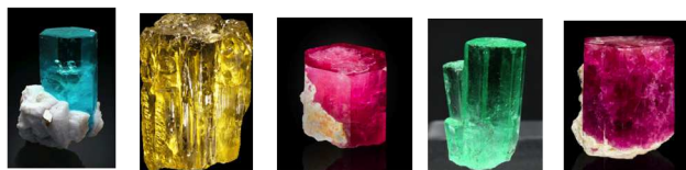
Figura 1. Diferentes minerales berilo, de izquierda a derecha: aguamarina, heliodoro, morganita, esmeralda y bixbita

El mineral berilo, que es un ciclosilicato de berilio y aluminio ( \text{Be}_3\text{Al}_2(\text{SiO}_3)_6 ), se conoce desde la antigüedad en diversas formas. Esta sal es incolora, pero diferentes impurezas confieren al berilo colores diversos que caracterizan una serie de piedras semipreciosas o preciosas (Figura 1), como el aguamarina (azul, debido a impurezas de \text{Fe}^{2+} ), el heliodoro (el berilo más abundante cuyo nombre alude a su color amarillo miel debido a impurezas de \text{Fe}^{3+} ), la morganita o berilo rosa (cuyo color viene causado por impurezas de \text{Mn}^{2+} ), la esmeralda (verde, color producido por impurezas de Cr y a veces V) o la bixbita o esmeralda roja (cuyo color se debe a impurezas de \text{Mn}^{3+} ).