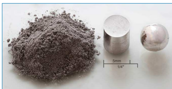
Figura 1. Un gramo del elemento químico rodio en diversas formas: polvo, cilindro obtenido por presión, bola refundida obtenida bajo argón usando un arco eléctrico.

El rodio es un metal de color blanco plateado (Figura 1), dúctil y duro, que cristaliza en una red cúbica centrada en las caras. Incluso pulverizado finamente, se disuelve muy lentamente en agua regia o ácido sulfúrico concentrado (se disuelve mejor en una mezcla de HCl y NaClO 3 en caliente). El máximo estado de oxidación alcanzable es el +6, i. e. RhF 6 , pero los estados de oxidación superiores a +3 son oxidantes fuertes. Mientras que el estado de oxidación +2 es el más estable para cobalto en agua, Rh(III) es mucho más estable que Rh(II), que es un reductor fuerte. La importante química de coordinación de Rh(I) está casi enteramente dominada por ligandos aceptores \pi .