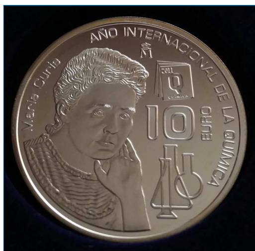
Figura 1. Moneda conmemorativa de plata emitida por la Fábrica Nacional de Moneda y Timbre con motivo del Año Internacional de la Química celebrado en 2011

Aunque la plata es un metal precioso cuyo uso más extendido en el imaginario popular es el de la joyería y el de la numismática (Figura 1), existen otros campos donde presenta unas propiedades que la convierten en un elemento especial. Por ejemplo, es el metal con una mayor conductividad térmica y eléctrica. Por las propiedades eléctricas de la plata es habitual el uso del electrodo de referencia Ag/AgCl en medidas electroquímicas. [2] Sin embargo, el elevado coste de la plata en comparación con el del cobre limita hoy en día su uso extendido y masivo en los circuitos de los dispositivos electrónicos comunes. En segundo lugar, la plata es el metal que a longitudes de