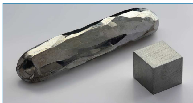
Figura 1. Una barra de cristal de cadmio (pureza 99,999 %) obtenida por el proceso de flujo y un cubo de 1 cm 3 de cadmio [1]

En las industrias aeroespacial y aeronáutica también se usa el cadmio para el recubrimiento de superficies de hierro y acero, por ser un eficaz protector contra la corrosión. Así, el cadmio se encuentra presente en tuercas de seguridad, tornillos y algunos componentes de trenes de aterrizaje. En los últimos años se están investigando alternativas como deposición de aluminio [7] o deposiciones de zinc-níquel, [8] sobre acero 4340.