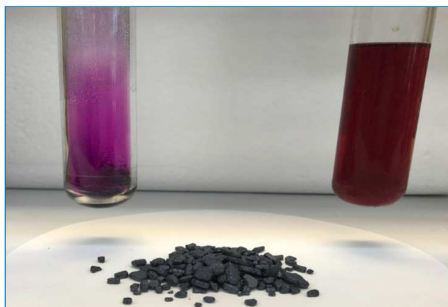
Figura 1. Yodo: vapor característico, yodo cristalino y solución de yodo en diclorometano. Composición del autor

El yodo es el más pesado entre los halógenos estables y el único que es sólido a temperatura ambiente. Se sublima fácilmente para generar un particular gas púrpura (Figura 1). Por sí mismo, tiene características de un metal, pero reacciona fácilmente con la mayoría de los otros elementos dando lugar a los correspondientes yoduros. El yodo da lugar a una rica familia de compuestos siendo capaz de aparecer en los estados de oxidación -1, 0, +1, +3, +5, +6 y +7. [2,4] Un valioso reactivo de yodo(I) fue inventado en España y se conoce como reactivo de Barluenga . [5] Recientemente, los derivados polivalentes de yodo(III) y yodo(V) han suscitado aplicaciones novedosas en la química orgánica sintética. Como resultado, los compuestos de yodo son considerados como una importante clase de oxidantes sostenibles,