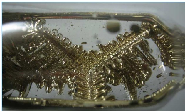
Figura 1. Muestra policristalina de Cs elemental en Ar [4]

Se conocen más 30 radioisótopos artificiales, todos ellos producto de reacciones de fisión nuclear, en armas o reactores nucleares. Estos isótopos aparecen en la atmósfera a partir