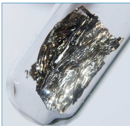
Figura 1. Muestra de samario metálico conservada en atmósfera inerte en una ampolla de vidrio [3]

El samario metálico se obtiene principalmente por reducción de su óxido (Sm 2 O 3 ) con bario o lantano. [2] Recién preparado tiene aspecto plateado brillante (Figura 1), [3] pero se oxida lentamente al aire recubriéndose de un polvo grisamarillento del óxido. También reacciona de forma moderada con el agua para dar Sm(OH) 3 e hidrógeno. El metal es muy paramagnético a temperatura ambiente y se usa principalmente en la producción de potentes imanes permanentes de aleación samario-cobalto, superados en fuerza solo por los de neodimio-hierro-boro, pero con mucha mejor estabilidad térmica que estos últimos. Los imanes de samario-cobalto se emplean en aplicaciones a alta temperatura y también en