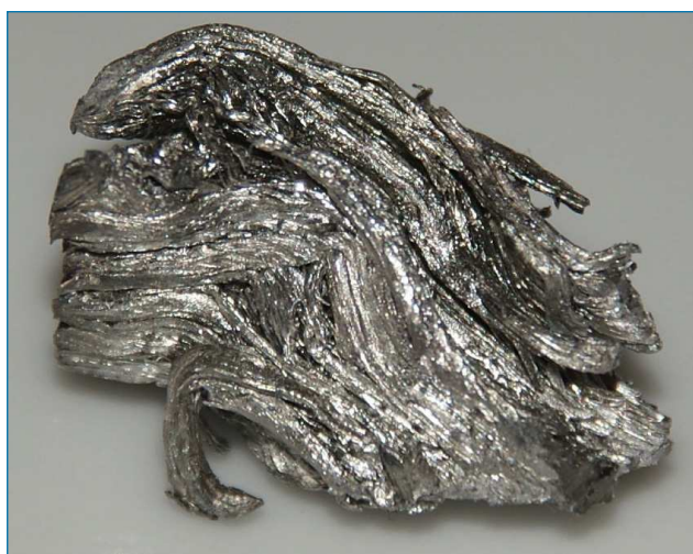
Figura 1. Holmio metal [bit.ly/2HFvhXI]

Sólo tiene un isótopo estable, el holmio-165, pero se conocen 30 isótopos radiactivos sintéticos con masas ente 141 y 172, siendo el holmio-163 el de mayor vida media con 4570 años.