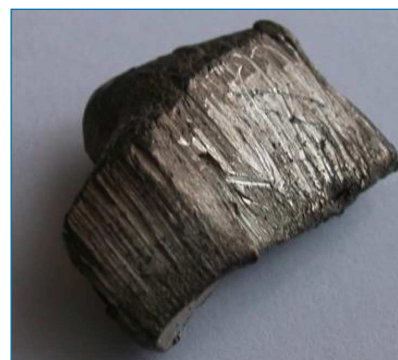
Figura 1. Iterbio metálico [2]

El iterbio puede llegar al medio ambiente por los vertidos de industrias petroquímicas o por electrodomésticos en desuso. Se puede acumular gradualmente en los suelos y contaminar sus aguas, lo que puede incrementar su concentración en los seres humanos y otros animales, hasta provocar daños en las membranas celulares y afectar al sistema nervioso central. [4]