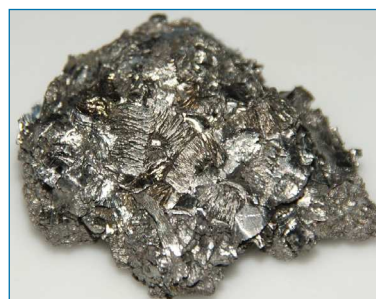
Figura 1. Hafnio electrolítico (muestra de unos 3 cm de largo) [4]

circonio [Zr(η 5 -Cp) 3 (η 1 -Cp)]. Por su tamaño, el metal puede mostrar números de coordinación desde 4, por ejemplo con ligandos amiduro voluminosos, mayores de 6 con ligandos duros (O y N-dadores o F - ), o hasta 12 como formalmente se asigna en los complejos con ligandos tetrahidruoborato [M{(μ-H) 3 BH 4 }] (M = Zr, Hf).