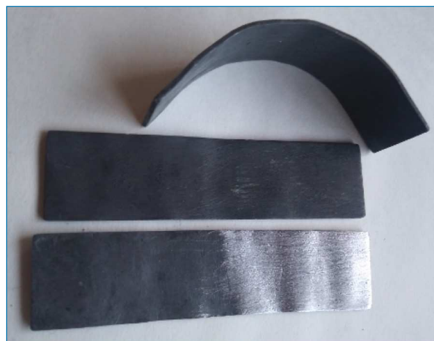
Figura 1. Láminas de plomo. La situada en la parte superior de la imagen ha sido doblada (con la mano) para mostrar la gran plasticidad del metal. La situada en la parte inferior ha sido lijada en su mitad derecha para mostrar el brillo metálico.

Actualmente el plomo se emplea fundamentalmente (75 %) en la fabricación de baterías de arranque (Uniplom, http://www.uniplom.es/principal.htm , visitada el 01/02/2019). El índice de reciclado del plomo está muy por encima de todos los demás metales, estimándose que se recicla el 85 % del plomo consumido. Durante el siglo xx el consumo de plomo se multiplicó por ocho.