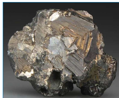
Figura 2. Bismuto nativo [https://bit.ly/2EWaAm9, visitada el 08/03/2019]

forma cristales romboédricos que ocupan más volumen que el metal fundido. Esa propiedad, combinada con un bajo punto de fusión, hacen al Bi y a sus aleaciones materiales aptos para la soldadura. Su química es poco llamativa. Con potencial estándar de reducción Bi 3+ /Bi de 0,308 V, resiste bien la oxidación en condiciones ambientales; pero caliente al rojo, reacciona con O 2 y con H 2 O para dar su óxido característico amarillo, Bi 2 O 3 , que no muestra carácter ácido ni se disuelve en álcalis.