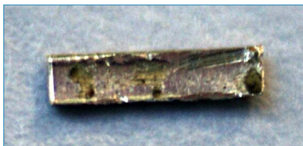
Figura 1. Radio-226 electrodpositado sobre lámina de cobre y recubierto con poliuretano para evitar la oxidación [7]

Los pocos usos del radio se basan en su principal característica: la radioactividad. 1 g de 226 Ra produce 3,7·10 10 desintegraciones por segundo (Bq) y fue la cantidad de radioactividad con la que se definió la primera unidad de radioactividad, el curie (Ci), en 1910. Aunque en las décadas de 1940 y 1950, el uso de radio como tratamiento médico se redujo a muy pocas aplicaciones por su alto precio y su gran peligrosidad, debido al complejo manejo de pequeñas cantidades, el principal uso de los isótopos de radio sigue siendo la terapia médica. Actualmente, existen algunos tratamientos radioterapéuticos que usan 226 Ra en braquiterapia. También se usa el 223 Ra, como emisor alfa, para el tratamiento de las metástasis óseas derivadas de cáncer de próstata. [5] Otras aplicaciones de los isótopos de radio son técnicas geofísicas en las prospecciones petroleras, radiografía industrial, producción de estándares radioquímicos o señales luminosas. Recientemente, la presencia de los diversos isótopos de radio en las distintas matrices geológicas se han utilizado como trazadores de procesos ambientales, como la descarga de agua subterránea o trazadores de masas de agua. [6]