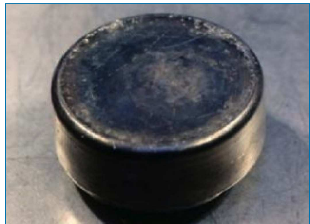
Figura 1. Lingote metálico de plutonio [5]

Además de los usos bélicos y de la producción de energía, el 238 Pu, con un período de semidesintegración de 87,74 años, se usa como fuente de calor en misiones espaciales y se utilizó como pila de marcapasos, eterna para la vida humana.