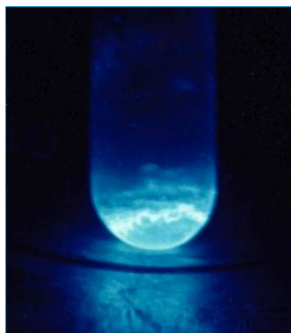
Figura 1. Fotografía de einstenio metálico luminiscente tomada de Wikipedia. [7] El reconocimiento debe hacerse a Richard G. Haire, US Department of Energy (ver referencia 1, p. 1580 donde aparece la fotografía)

El einstenio es un metal auto-luminiscente (Figura 1) y, aunque su radiactividad dificulta mucho la aplicación de las técnicas de difracción de rayos X, ya se ha determinado su estructura cristalina (red cúbica centrada en las caras), su radio atómico (2,03 Å) y su primera energía de ionización (6,3676 eV). [1] El tamaño atómico supone un brusco aumento en la serie de los actínidos, lo que se explica porque es el primero