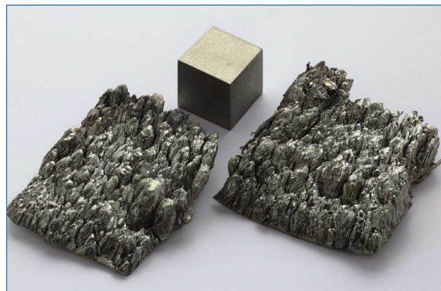
Figura 1. Escandio sublimado del 99.998% de pureza. Se muestra también un cubo de 1 cm 3 de escandio fundido en atmósfera de argón [2]

La producción de escandio está muy ligada a la de uranio, aunque cada vez más se emplean menas específicas de este metal, como la thorveitita. Los principales productores son China, Kazajistán, Ucrania y Rusia. Se considera que a medio plazo las reservas más abundantes se explotarán en Australia.