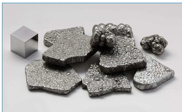
Figura 1. Hierro de alta pureza (más de 99,97 %) refinado electrolíticamente y un cubo de hierro de alta pureza de 1 cm de lado [4]

Además, el hierro es un elemento esencial para la vida. Se encuentra en prácticamente todos los organismos, lo cual se relaciona con su abundancia en la corteza terrestre y por lo tanto, con su disponibilidad durante la evolución. [5] La cantidad de hierro que contiene el cuerpo humano está alrededor de 4 gramos y se requiere de un aporte diario de entre 10 y 18 mg. Su deficiencia lleva al desarrollo de la anemia. La mayor parte de este hierro se localiza en el centro activo de proteínas con funciones claves para la vida. Por ello resulta un elemento fundamental en la estructura de la mioglobina, proteína encargada del almacenamiento de O 2 , y de la hemoglobina, proteína responsable del transporte de O 2 en la sangre dentro de los glóbulos rojos. Además, existen muchas otras enzimas involucradas en procesos de activación del oxígeno y en el transporte de electrones que también contienen hierro en su centro activo, como por ejemplo citocromo P450, citocromo c oxidasa, proteínas Fe-S, catalasas o peroxidases. [5] Algunos de estos sistemas biológicos sirven de inspiración para el desarrollo de catalizadores sintéticos.