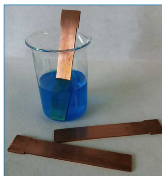
Figura 1. Electrodo de cobre en disolución de CuSO 4 (Laboratorio de Química, Escuela de Ingeniería de Bilbao)

"cardenillo", pátina tóxica. Se disuelve fácilmente en los ácidos nítrico y sulfúrico concentrados por ser oxidantes, y es atacado por los halógenos y el azufre.