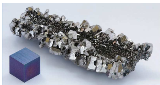
Figura 1. Cristales de niobio de alta pureza (99,995 %) formados por electrolisis, al lado de un cubo de 1 cm 3 de alta pureza (99,995 %) de niobio anodizado ( https://bit.ly/2t05AL4 , visitada el 04/03/2019)

El niobio es el 33º elemento más abundante en la corteza terrestre. Con 20 ppm, no se encuentra libre en ella, sino combinado con otros elementos en minerales como la columbita [(Fe,Mn)Nb 2 O 6 ], el coltán (columbita-tantalita) [(Fe,Mn)(Nb,Ta) 2 O 6 ], el pirocloro [(Na, Ca) 2 Nb 2 O 6 (OH,F)] y la euxenita [(Y,Ca,Ce,U,Th)(Nb, Ta, Ti) 2 O 6 ]. Es un metal estratégico, pero su disponibilidad está limitada y existe un futuro riesgo de abastecimiento como se muestra en la recientemente publicada tabla periódica de los elementos químicos de EuChemS. [2] Hasta la década de 1950 la columbita era la mayor fuente de niobio. Posteriormente se descubrió la mina más grande del mundo de pirocloro (2,5 % Nb 2 O 5 ) en Araxá, Brasil. Los principales países productores de niobio son: Brasil