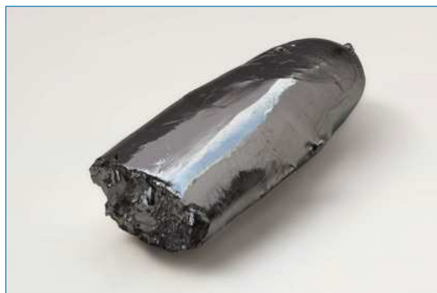
Figura 1. Barra de rutenio de alta pureza (99,99 %) obtenido mediante un procedimiento de fusión con haz de electrones [4]

aplicación más destacada en química es como catalizador de diversas reacciones de síntesis orgánica, estudios que han sido reconocidos con dos premios Nobel en este siglo. Probablemente la más relevante de ellas sea la metátesis de olefinas, una de las reacciones que más impacto ha tenido en la síntesis orgánica en los últimos años. Aunque ya era conocida en los años 60 del siglo pasado, recibió un impulso decisivo para su aplicación industrial con la introducción de los catalizadores homogéneos de rutenio de composición bien definida y estables al agua y al aire desarrollados por Robert H. Grubbs, [5] a quien se concedió junto a Yves Chavin y Richard Schrock el premio Nobel de Química en 2005 por el desarrollo del método de metátesis en síntesis orgánica. El otro premio Nobel (compartido) es el otorgado a Ryoji Noyori en 2001 por sus trabajos sobre hidrogenaciones enantioselectivas con catalizadores quirales de Ru. También se ha explorado como catalizador del proceso Fischer-Tropsch para la síntesis de hidrocarburos a partir de H 2 y CO, en la que presenta ventajas frente a los catalizadores de Co y Fe. Algunos de sus compuestos se están estudiando por su actividad antitumoral, en la que tiene beneficios respecto al cisplatino, y por sus propiedades fotoquímicas.