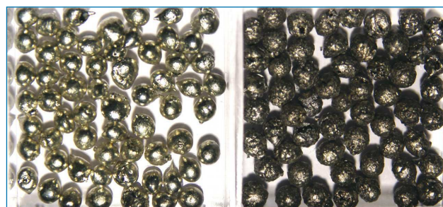
Figura 1. Estaño de alta pureza (99,999 %) en sus formas alotrópicas \beta (estaño blanco, izq.) y \alpha (estaño gris, der.) [3]

El estaño, debido a su bajo punto de fusión, es ampliamente utilizado en la soldadura de circuitos electrónicos y fontanería. Un último ejemplo, algo más trivial es en la producción de láminas planas de vidrio que se obtienen colocando el vidrio fundido sobre una superficie de estaño fundido en un recipiente grande y poco profundo para su enfriamiento.