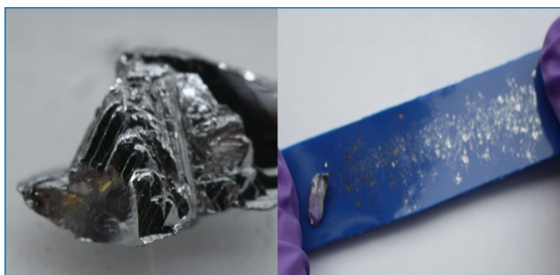
Figura 1. Imagen de un cristal de antimonio (izda.) y un paso del proceso de exfoliación micromecánica que condujo al aislamiento del alótropo denominado “antimoneno” (dcha). [4]

Como se observa en la Figura 1, el antimonio presenta brillo metálico y apariencia escamosa, de hecho, tiene una