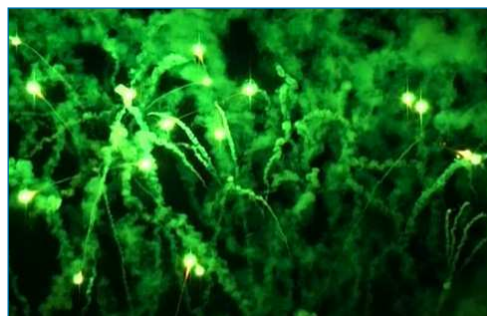
Figura 2. El nitrato y el clorato de bario se emplean en pirotecnia para dar colores de tonalidad verde [5]

El BaSO 4 se utiliza en medicina como agente de contraste para diagnosticar patologías del tracto gastrointestinal, como el esófago, el estómago y el intestino delgado. Fue en 1908 cuando el sulfato de bario se aplicó por primera vez como un agente de contraste radiológico. [3] Es bien conocido que una radiografía produce una imagen deficiente de los tejidos blandos, sin embargo, el revestimiento de bario produce una silueta suficientemente definida que permite detectar la posible presencia de pólipos o inflamaciones intestinales. Cuando el contraste (enema opaco) se introduce por el recto se pueden detectar posibles patologías del colon (intestino grueso). Su uso en medicina es posible por la muy baja solubilidad del BaSO 4 (0,000285 g/100 ml). El BaSO 4 también se utiliza en placas de yeso para blindaje contra rayos X libre de plomo.