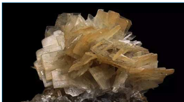
Figura 1. La barita o baritina, BaSO 4 , es un mineral que tiene una alta densidad (hasta 4,5 g/cm 3 ) [4]

La baritina se encuentra en la naturaleza como aglomeraciones cristalinas de color blanco, verdosas, grisáceas o rojizas (Figura 1). Es un mineral barato, limpio y relativamente suave. La gran mayoría de la barita que se extrae es utilizada por la industria del petróleo para aumentar la densidad de los lodos de perforación. La barita aumenta la presión hidrostática del lodo, lo que le permite compensar las altas presiones que se crean durante la perforación. El resto lo consumen fundamentalmente las industrias de pinturas, caucho y papel. Junto con el sulfuro de zinc forma el litopón , colorante blanco brillante muy estable e insoluble, con buenas propiedades de recubrimiento.