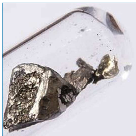
Figura 1. Pieza (1 cm aproximado de ancho) de lantano puro

Desde el punto de vista de su aplicación, sus peculiares propiedades físicas han generado un uso extensivo del mismo, en relación con las nuevas tecnologías. Así, en la