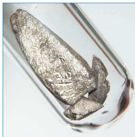
Figura 2. Muestra de europio metálico [4]

Debido a la facilidad con que forma compuestos divalentes, el europio acompaña en sus compuestos al Sr, Ba, Pb y Ca, por lo que es normal encontrarlo en titanatos, feldespatos y apatitos de plomo. La manera de comercializar el europio es como metal (Figura 2) [2] o en la forma de sales tanto divalentes como trivalentes. [3]