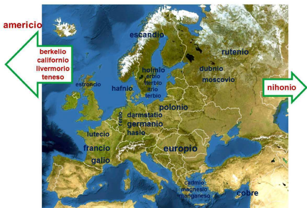
Figura 1. Localización de algunos elementos químicos, con denominación geográfica, en función de su nombre [1]

El europio es el metal más reactivo de los lantánidos, siendo esta su característica principal. Se disuelve rápidamente en agua formando sus hidróxidos; es atacado por los ácidos hidrácidos para formar haluros (EuX 2 ), y con los ácidos oxidantes forma compuestos de Eu(III).