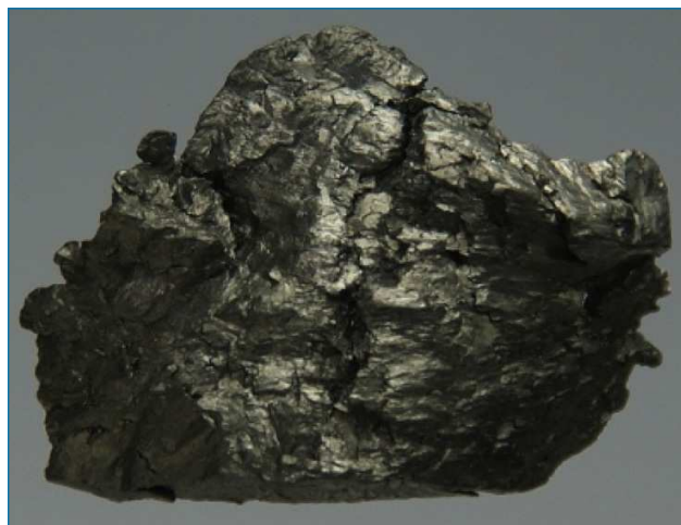
Figura 1. Gadolinio metálico ultrapuro, de unos 2 cm de lado

Otra interesante aplicación consiste en la utilización de gadolinio y alguna de sus aleaciones como refrigeradores magnéticos, haciendo uso de la propiedad de desmagnetización adiabática y el efecto magnetocalórico. [5]