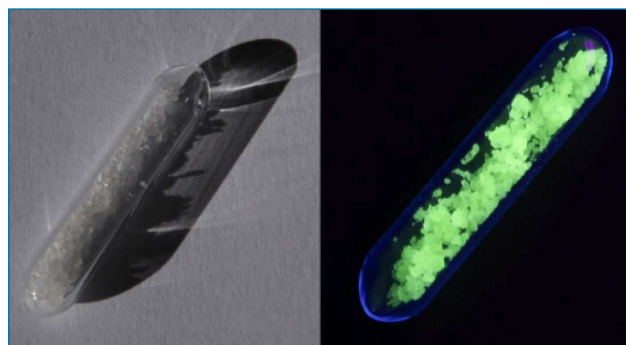
Figura 2. Cristales de sulfato de terbio(III) (izda.) y su emisión verde bajo iluminación de luz UV (dcha.) [5]

En su reacción con halógenos genera los correspondientes haluros y se disuelve rápidamente en ácidos diluidos acuosos que lo oxidan a su ion Tb 3+ , el cual genera sales caracterizadas por una fuerte emisión luminiscente de color verde cuando se encuentra excitado tras la absorción de luz UV (Figura 2). Esta propiedad puede dar lugar a un amplio número de aplicaciones, aunque el elevado coste del elemento supone una clara limitación. En primer lugar, el terbio se utiliza como agente dopante en materiales lumínicos empleados en pantallas de TV, móviles o fibras ópticas, donde este elemento genera un color verde de alta definición. En el ámbito biológico, los iones Tb 3+ se emplean para localizar microbios o incluso determinar centros activos de proteínas dada su coordinación a los grupos ácidos de los residuos pertenecientes a los aminoácidos. [4] Resulta interesante destacar que el brillo verde emitido por las bandas anti-falsificación bajo luz UV que incorporan los billetes de euro contienen compuestos formados por estos iones. Otras importantes aplicaciones derivan de sus propiedades magnéticas, ya que sus aleaciones con neodimio y disprosio generan imanes estables a altas temperaturas que son implementados en motores eléctricos.