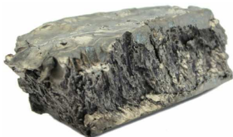
Figura 1. Muestra de terbio metálico de 235 g de alta pureza (99,9 %) [3]

Este metal reacciona con diferentes elementos a alta temperatura, entre los que se incluyen arsénico, silicio y carbono. Dado su carácter electropositivo reacciona con agua para dar hidróxido de terbio, Tb(OH) 3 , e hidrógeno, H 2 .