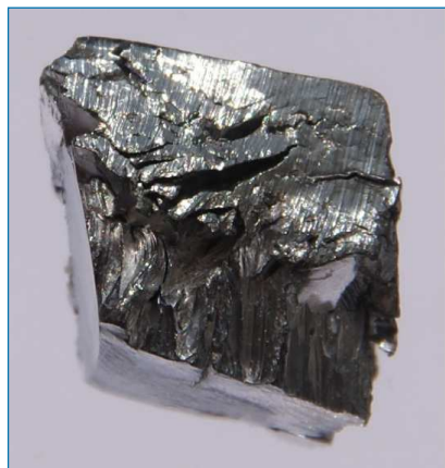
Figura 1. Muestra de lutecio puro ( https://bit.ly/2udQcrG , visitada el 10/01/2019)

El lutecio es un metal de color plateado, blando y dúctil (Figura 1), que en la naturaleza se encuentra mezclado con