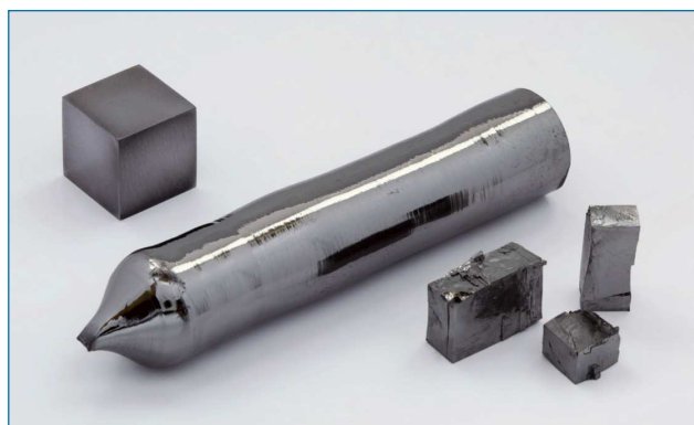
Figura 1. Cristal de tántalo de elevada pureza (99,999 %) preparado mediante el método de zona flotante, fragmentos cristalinos y cubo de 1 cm 3 (99,99 % = 4N) para su comparación [5]

La química del tántalo es sobre todo la del estado de oxidación +5, la reducción a estados de oxidación inferiores es difícil y da lugar a compuestos que, salvo en el caso de los clústeres, son inestables. Por otra parte, los deriva-