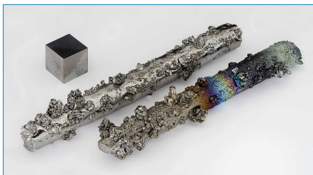
Figura 1. Varillas de wolframio con cristales evaporados, parcialmente oxidadas (pureza 99,98 %) y cubo de wolframio de 1 cm 3 de alta pureza (99,999 %) para su comparación [5]

fabricación de filamentos para lámparas eléctricas (ahora en desuso), tubos de vacío y de rayos X y en la técnica de evaporación de metales. Se ha utilizado para falsificar lingotes y joyas de oro por la semejanza de la densidad de ambos metales. Se emplea en bobinas y otros elementos de calefacción de hornos eléctricos que requieren trabajar a altas temperaturas y ser resistentes a la corrosión. Se utiliza en la industria militar, aeroespacial (motores y cohetes) y en catálisis.